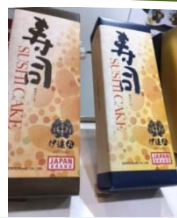
レインボー寿司 （国産農林水産物：カキ、米等）