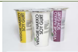
乳酸菌発酵大豆飲料 （国産農林水産物：大豆、安納芋等）