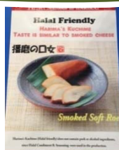
白子の燻製 （国産農林水産物：ポロ）