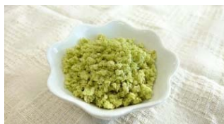
大豆シリアル食品 （国産農林水産物：大豆）