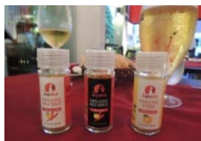
ゆずを使用した唐辛子及びパウダー商品 （国産農林水産物：ゆず、桑等）