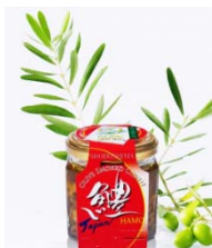
小豆島はものオリーブ 燻製コンフィ （国産農林水産物：はも、オリーブの実等）