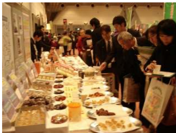
商品の試食・アンケートに回答する来場者

紹介コーナーには、和菓子、洋菓子と県内菓子メーカーによって作られた数多くの試作品が陳列され、商品の試食とアンケートへの回答で大変賑わっていた。