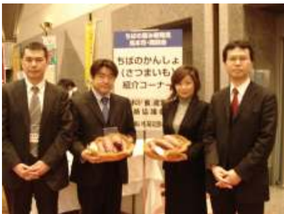
「ちばの「食」産業連絡協議会」事務局メンバー

今後は、実務で動ける会員も増やし、取組みを進めやすい組織体制を整えていきたいという。